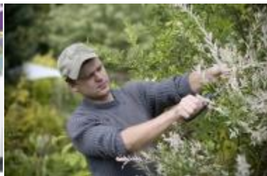
Dekoratyvinio apželdinimo verslo darbuotojas