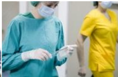
Plastinės ir rekonstrukcinės chirurgijos gydytojas