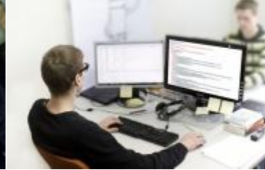
Programinės įrangos inžinierius