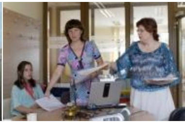
Socialinės rūpybos darbuotojas