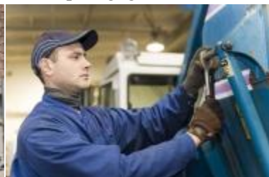
Žemės ūkio mašinų technikas