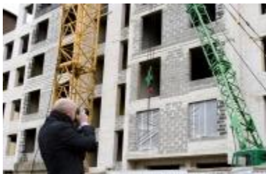
Nekilnojamojo turto agentas