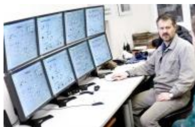
Trasų gamybos įrenginio operatorius