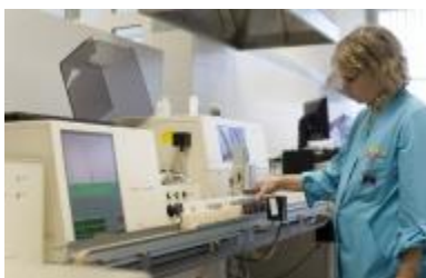
Maisto pramonės chemikas