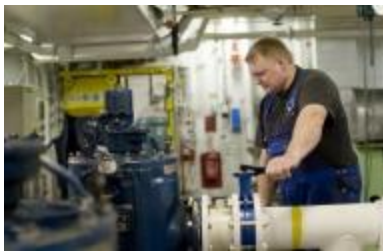
Jūrų laivo įrangos technikas