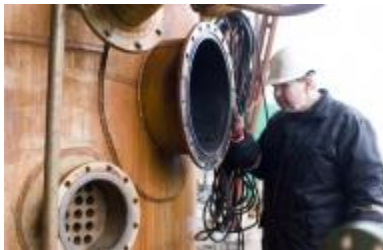
Pramonės įrenginių ir įrankių inžinierius