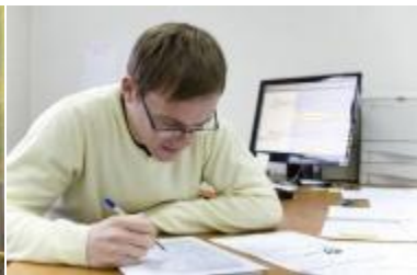
Kompiuterių sistemų analitikas