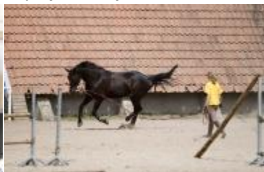
Žirgininkystės verslo darbuotojas