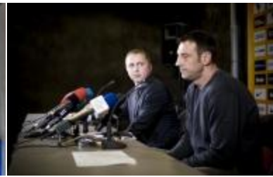
Atstovas ryšiams su visuomene