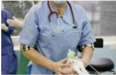
Gydytojas anesteziologas reanimatologas