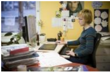
Leidinių maketuotojas (kompiuterinis maketavimas)