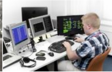
Kompiuterių tinklo administratorius