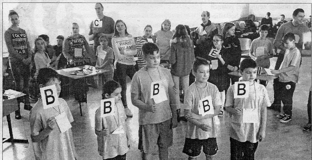
Drużyny miały do wykonania przeróżne wzięte z życia zadania matematyczne

Olga Jurkewicziene nauczyciel-metodyk matematyki Szkoły im. Sz. Konarskiego w Wilnie